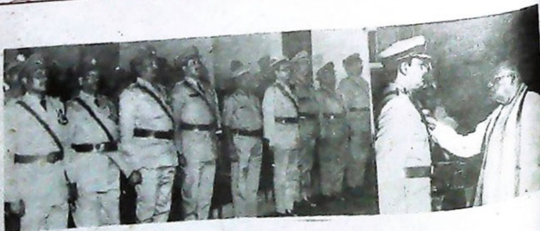
ପୁଲିଶ ଭବନରେ ଆୟୋଜିତ ଏକ ଉତ୍ସବରେ ମୁଖ୍ୟମନ୍ତ୍ରୀ ଶ୍ରୀ ବାଳଗା ବହୁର ପଟ୍ଟନାୟକ ପୋଲିସ୍ ପଦକ ପ୍ରଦାନ କରୁଛନ୍ତି । ୨୬-୧