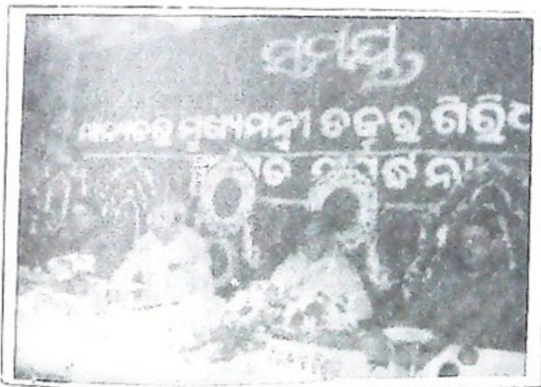
ଆହାରୀତ ପ୍ରକାଶନଠାରେ ମୁଖ୍ୟମନ୍ତ୍ରୀ ଡଃ. ଶିରିଧର ଗମାଙ୍ଗଙ୍କୁ ସମର୍ପିତ କରାଯାଇଛି ତା-୨୭.୨.୯୯