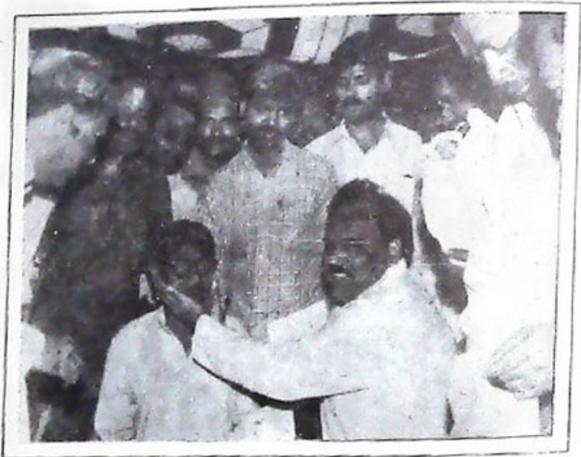
ମୁଖ୍ୟମନ୍ତ୍ରୀ ଦ୍ଵା. ଶିଳିଧର ଗମାଙ୍ଗ ତାଙ୍କ ବରମୁଣ୍ଡାସିତ ଦାସ ଭବନ ଠାରେ ହୋଇ ଖେଳାଳିମାନଙ୍କୁ ବଧାଇ ଉଦ୍ଘାଟନା ୩-୩.୩.୯୯