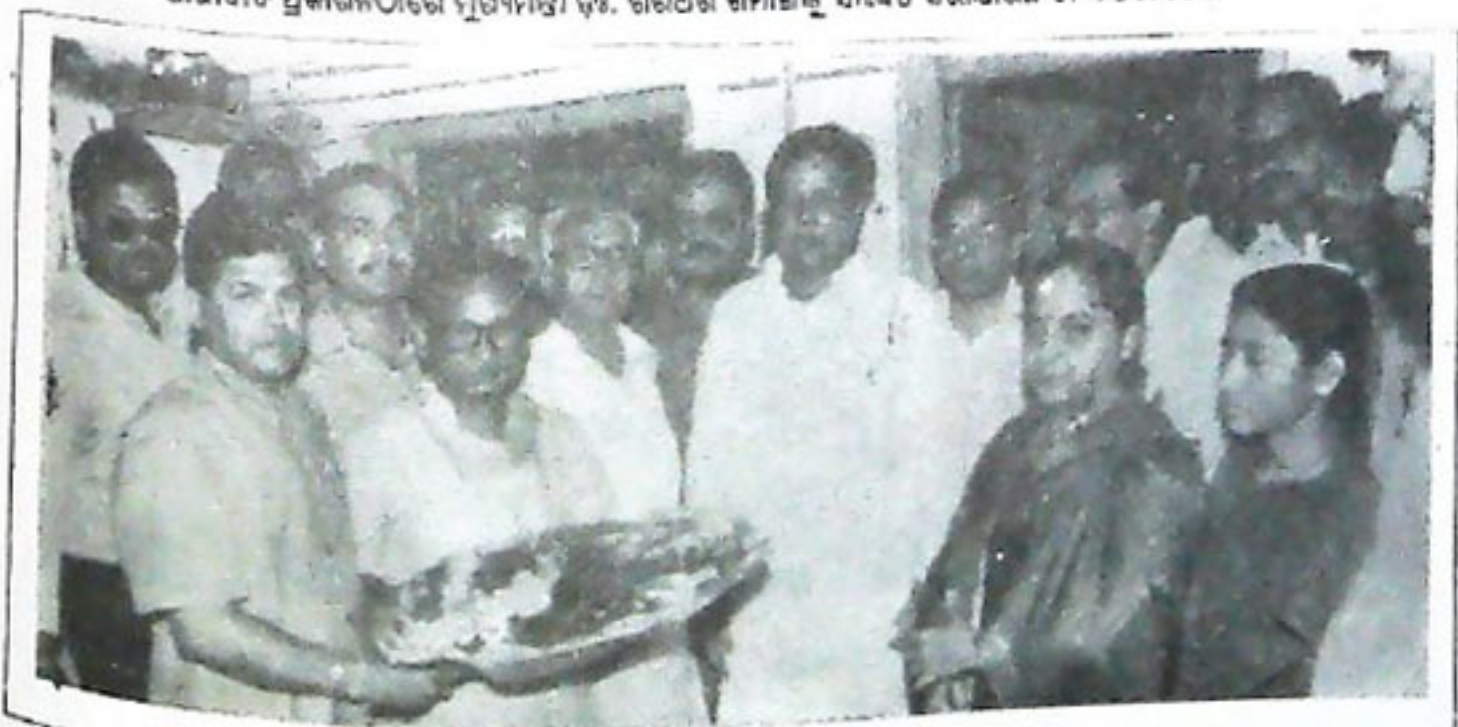
'ମାତୃଭାଷା' ପ୍ରକାଶନଠାରେ ମୁଖ୍ୟମନ୍ତ୍ରୀ ଡଃ. ଶିରିଧର ଗମାଙ୍ଗଙ୍କୁ ସମର୍ପିତ କରାଯାଇଛି ତା-୨୮.୨.୯୯