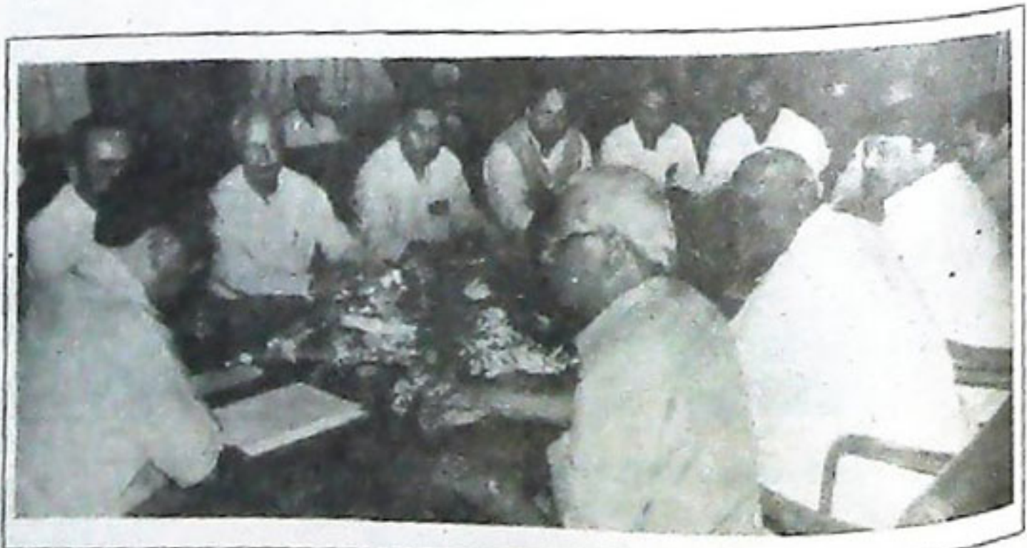
ସଚିବାଳୟରେ ମୁଖ୍ୟମନ୍ତ୍ରୀ ଡଃ. ଶିଶିର ଗମାଙ୍ଗୁ ସାଧାରଣ ଉଦ୍ୟୋଗରୁଚିର ପରିଚାଳନା ବିଷୟରେ ନିମ୍ନପୁରୁଷ ଅଧିକାରୀଙ୍କ ସହ ଆଲୋଚନା କରୁଛନ୍ତି ତା-୨.୩.୯୯