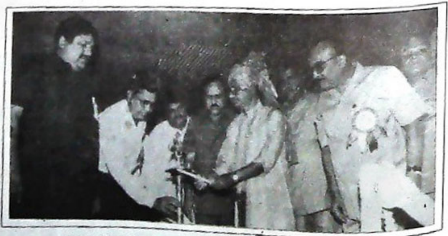
ଭୁବନେଶ୍ଵର ବିରଜା ଅତିଥି ଭବନଠାରେ ମାଲତୀ ପକ୍ଷୀର ଆନୁଷ୍ଠାନରେ ଆୟୋଜିତ ହୋଇ ଉପକ ମୁଖ୍ୟମନ୍ତ୍ରୀ ଦ୍ଵା. ଶିଳିଧର ଗମାଙ୍ଗ ଉଦ୍ଘାଟନା କରୁଛନ୍ତି ୩-୩.୩.୯୯