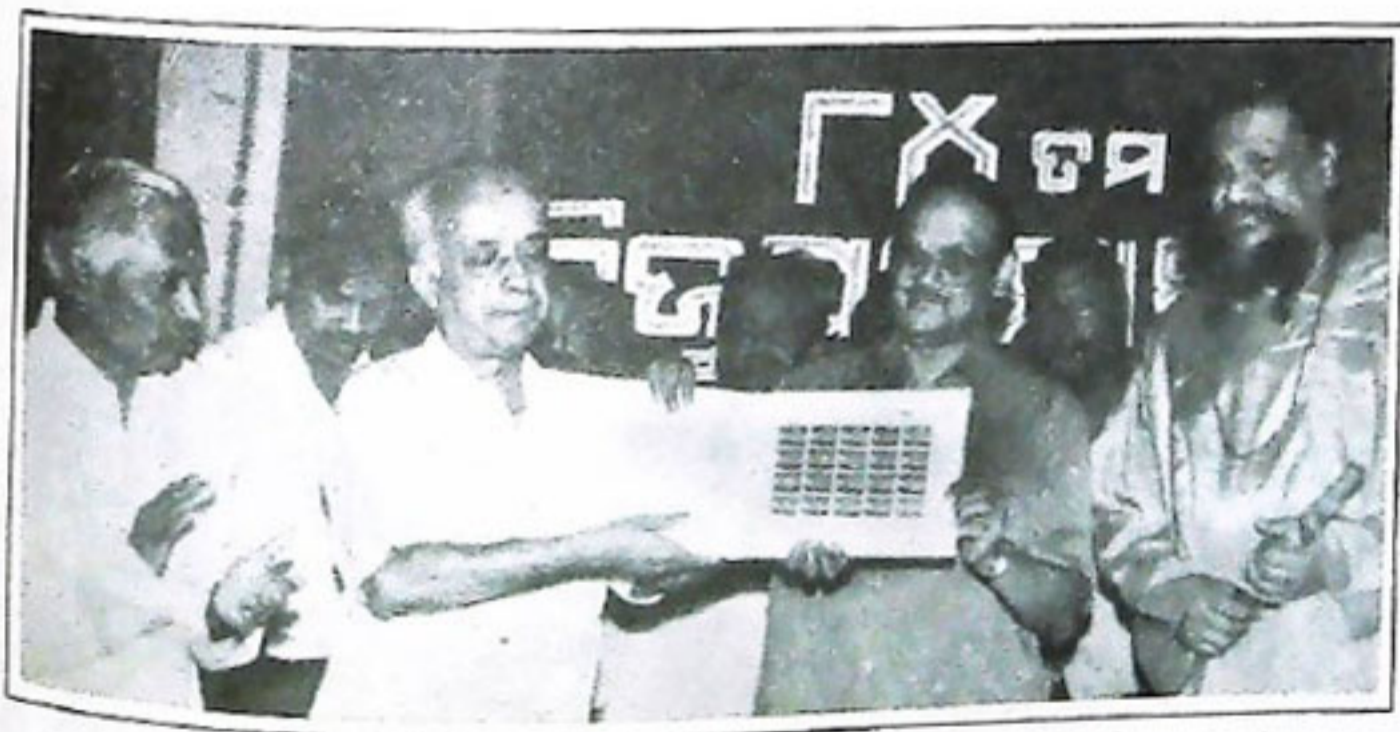
ନବୀନ ନିବାସଠାରେ ସ୍ୱର୍ଗତ ବିଜୁ ପଟ୍ଟନାୟକଙ୍କ ଫାକ୍ସ ଜୟତା ପାଳନ ଅବସରରେ ମୁଖ୍ୟ ଶାସନ ସଚିବ ଶ୍ରୀ ସହଦେବ ସାହୁ ଓ ମହାତାତପାଳ ଶ୍ରୀ ଏସ.ବି.ରାଜାଚାର୍ଯ୍ୟ ତାଙ୍କ ସ୍ମୃତି ଉଦ୍ଦେଶ୍ୟରେ ଏକ ତାବତିଜେତ ଉଦ୍ଘୋଷଣ କରୁଛନ୍ତି