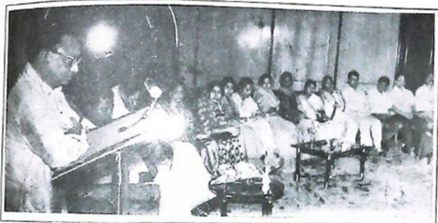
ହୋଟେଲ ସୁସିଠାରେ ଆୟୋଜିତ ରୁବନେଶ୍ୱର ନଗରପାଳିକା ମହାନିଗମ ପରିଷଦର ସଭ୍ୟମାନଙ୍କୁ ମୁଖ୍ୟମନ୍ତ୍ରୀ ଡଃ. ଶିଶିଧର ଗମାଙ୍ଗ ଭାଷଣ ଦେଉଛନ୍ତି ତା-ମା.ମା.୯୯