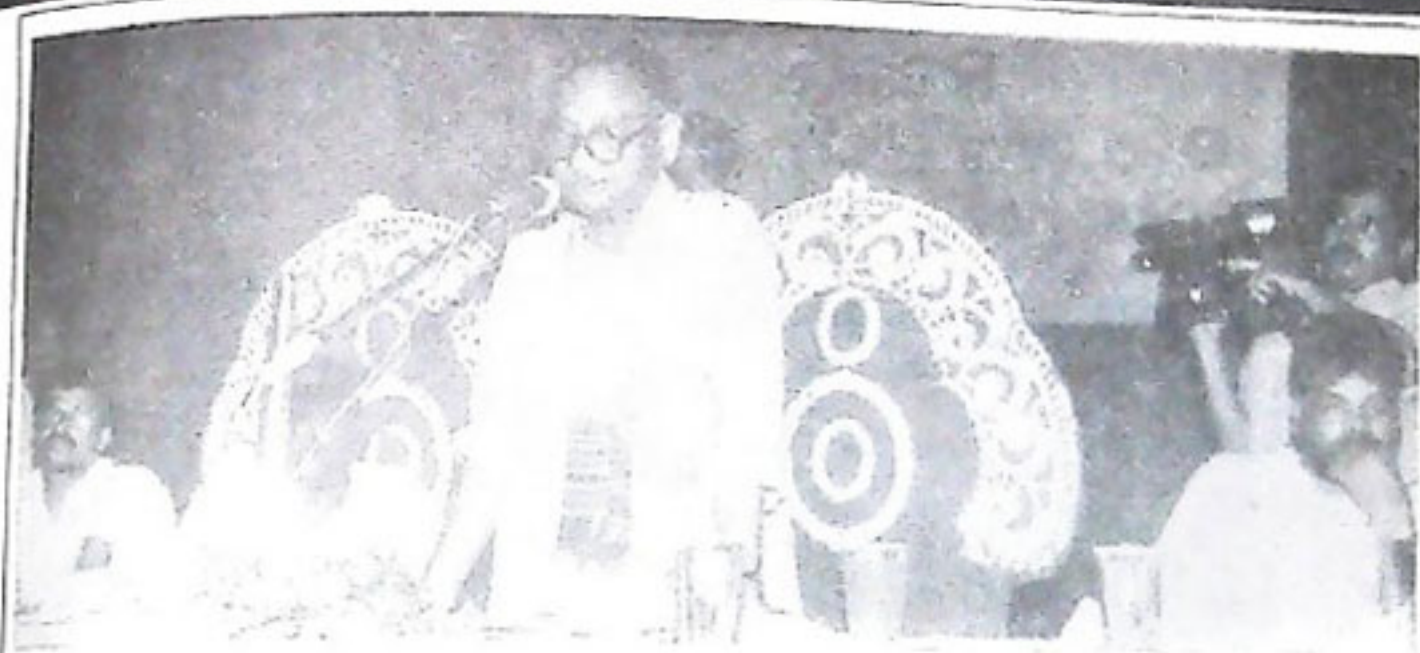
ଏ.ଡି. ଭୋଇ ବିଭବିନୋଦନ ବେଦୁ ଆନୁକୂଲ୍ୟରେ ଆୟୋଜିତ ୧୧ତମ ରାଜ୍ୟସ୍ତରୀୟ ଗପ ସଂସ୍କୃତିକ ସମାଜ ଭବନରେ ମୁଖ୍ୟମନ୍ତ୍ରୀ ଡଃ. ଶିରିଧର ଗମାଙ୍ଗ ଗାଷଣ ଦେଉଛନ୍ତି ତା-୨୮.୨.୯୯