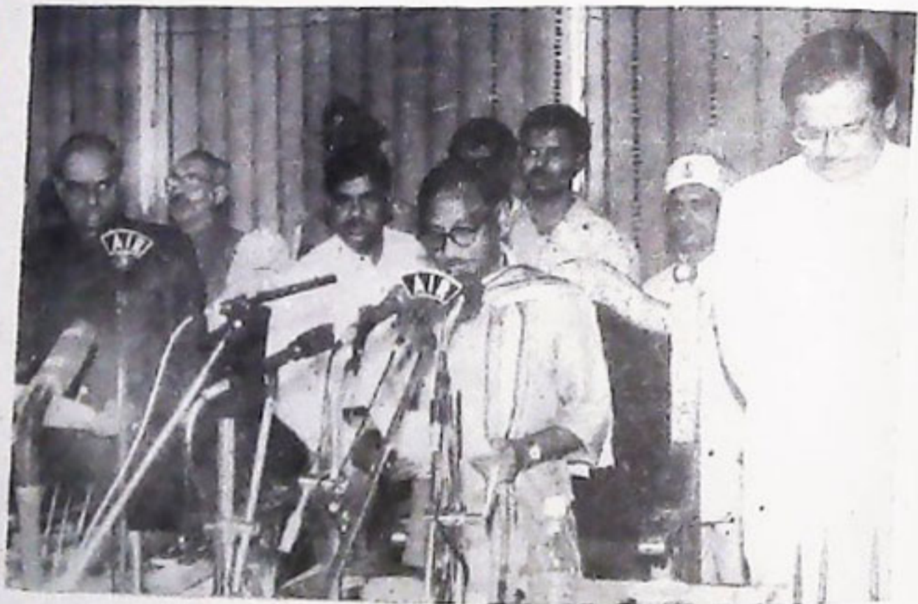
ଓଡ଼ିଶାର ମାନ୍ୟତର ଭାବ୍ୟପାଳ ଡଃ ବି : ରଞ୍ଜନାଚଳ ଓଡ଼ିଶାର ନୂତନ ମୁଖ୍ୟମନ୍ତ୍ରୀ ରାଜେ ଡଃ ବିଲିଧର ସମାପ୍ତ ସପଥ ପାଠ କରାଉଛନ୍ତି । ୧୭-୨-୧୯୯୯